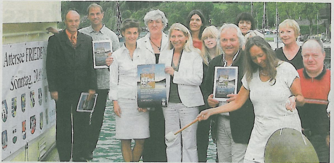
Das Organisationskomitee des Friedensfests am Attersee bietet ein umfangreiches Programm und freut sich auf zahlreiche Besucher.

Seewalchen: Promenade von 16 bis 21 Uhr Programm für und von den Kindern und der Jugend, Zukunftlichterkette über die Agerbrücke.