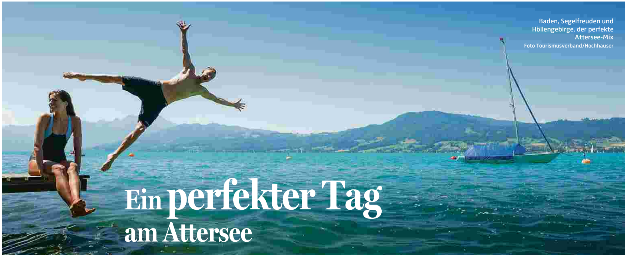
Baden, Segelfreuden und Höllengebirge, der perfekte Attersee-Mix